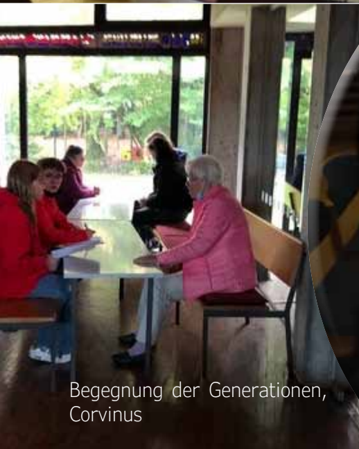
Begegnung der Generationen, Corvinus