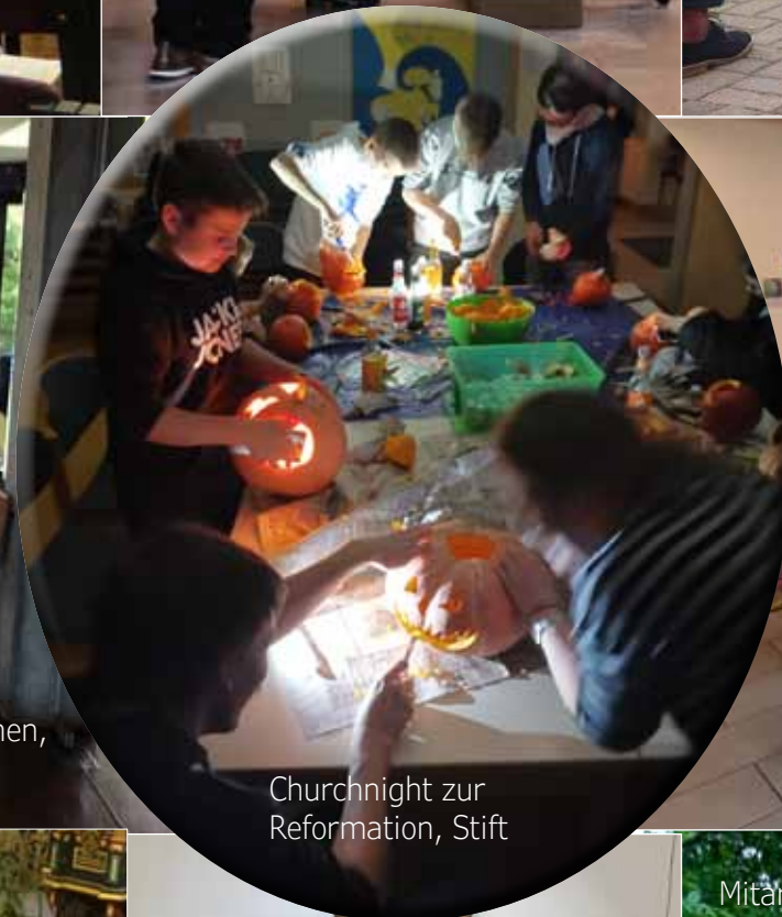
Churchnight zur Reformation, Stift