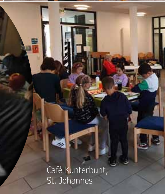
Café Kunterbunt, St. Johannes