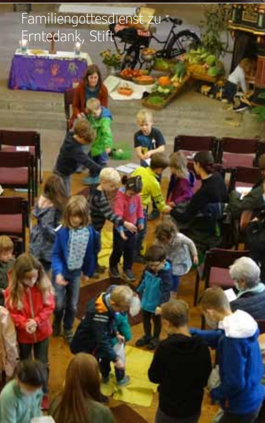
Familiengottesdienst zu Erntedank, Stift