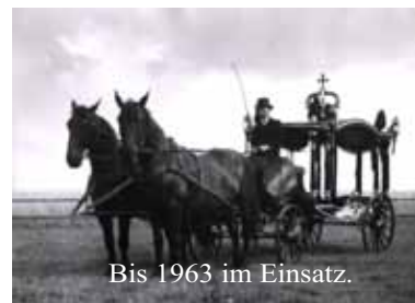
Bis 1963 im Einsatz.

Eine telefonisch Kontaktaufnahme raten wir immer an, da wir berufsbedingt nicht immer im Büro sind.