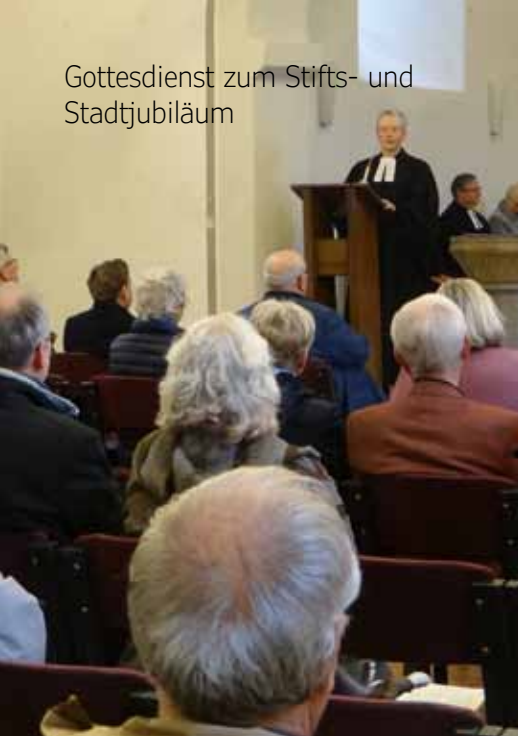
Gottesdienst zum Stifts- und Stadtjubiläum