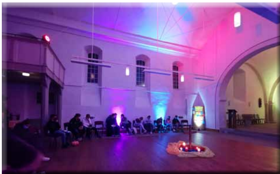
Churchnight in der Stadtkirche

In den Zeugnisferien findet vom 28. Januar – 1. Februar 2022 in der Heimvolkshochschule Loccum der nächste Juleica-Kurs statt. Alle Jugendlichen ab 15 Jahren, die Lust haben in die Arbeit mit Kindern, KonfirmandInnen und Jugendlichen einzusteigen, sind herzlich eingeladen. Anmeldeflyer sind in den Gemeindehäusern und beim Kirchenkreisjugenddienst erhältlich. Anmeldeschluss ist der 5. Dezember.