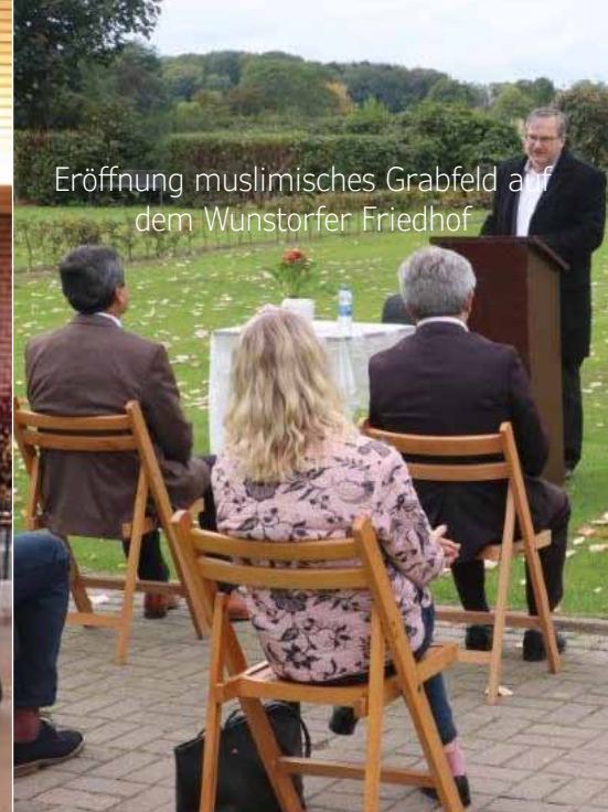
Eröffnung muslimisches Grabfeld auf dem Wunstorfer Friedhof