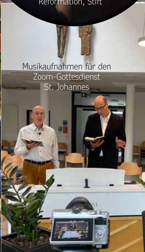
Musikaufnahmen für den Zoom-Gottesdienst St. Johannes